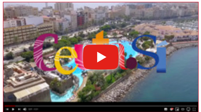
PARQUES Y PLAYAS