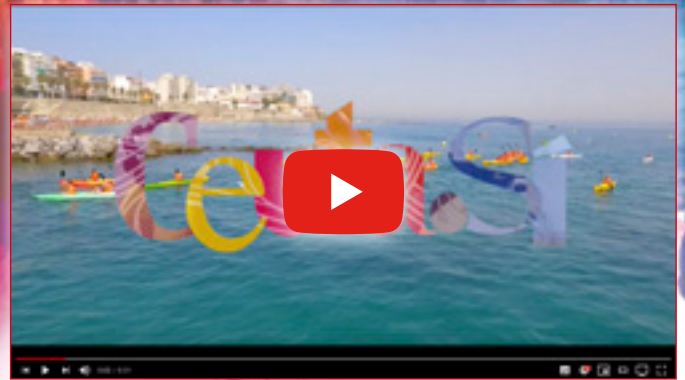
ACTIVIDADES AL AIRE LIBRE