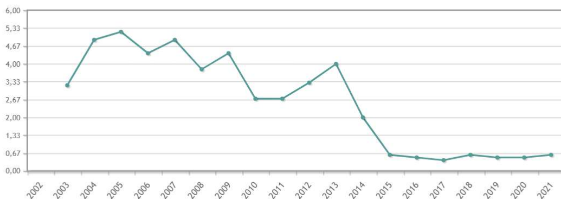
Figura 3. Índice de agua (IPC).

Tal y como se puede observar en la siguiente gráfica, nuevamente estamos ante un coste sujeto a una variación recurrente en su precio y que, por lo tanto, es susceptible de ser considerado como una partida de coste revisable según lo establecido en el RD 55/2017.