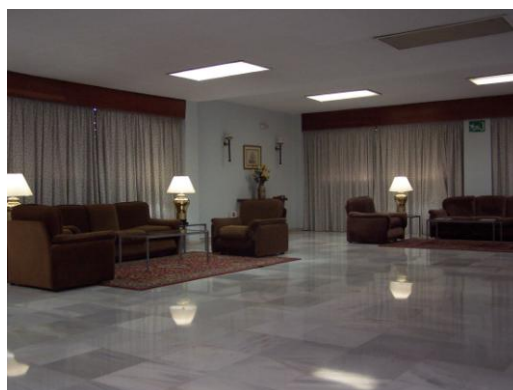
Salón de Estar

Para poder acceder a la hospedería, lo podemos hacer por la entrada principal del edificio, existiendo dos ascensores y unas escaleras para dicho fin.