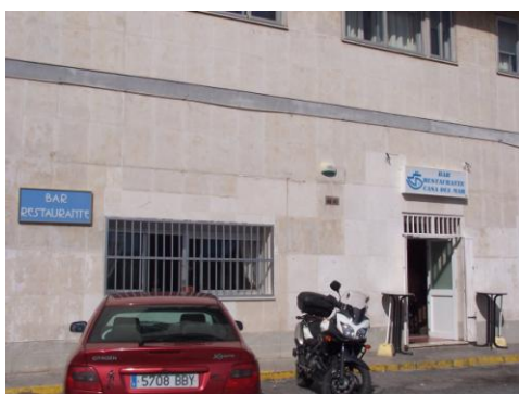
Cafetería-Bar Restaurante CASA DEL MAR

En la fachada este del edificio existe un Bar-Restaurante con servicio de desayuno y menú con precios populares.