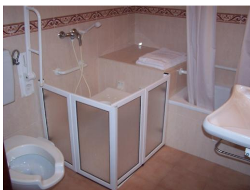
Baño adaptado para huéspedes con necesidades especiales