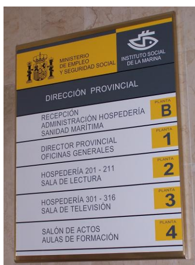
Cartel Anunciador de la distribución de las diferentes dependencias de la Dirección Provincial del ISM en Ceuta

Esta Dirección Provincial dispone de una hospedería con 27 habitaciones con baño (seis son habitaciones individuales y veintiuna son dobles, estando una de estas dobles adaptadas para minusválidos) y se distribuyen entre la segunda y tercera planta del edificio.